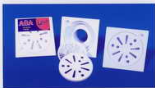
کد ۲۸ - کفشوی ۱۲x۱۲ آبا دارای خروجی سایز ۶ و ۱۰ با طراحی منحصر به فرد