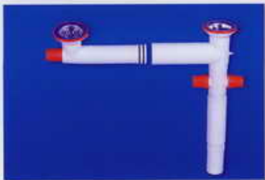
کد ۲۲- سیفون دولگنه آبا با سه خروجی (خروجی لباسشویی ، ظرفشویی و سرریز) مورد مصرف : سینکهای دولگنه