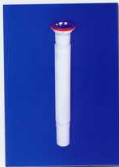
کد ۳۱- سیفون تک لگنه بلند آبا (۱۵۰ سانتی متر) موارد مصرف: سینکهای تک لگنه، روشویی و موارد خاصی که خروجی فاضلاب در محل استاندارد خود تعبیه نشده است