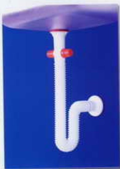
کد ۲۴- سیفون تک لگنه آبا با دو خروجی ( خروجی سرریز و لباسشویی یا قرفشویی ) مورد مصرف: سینکهای تک لگنه