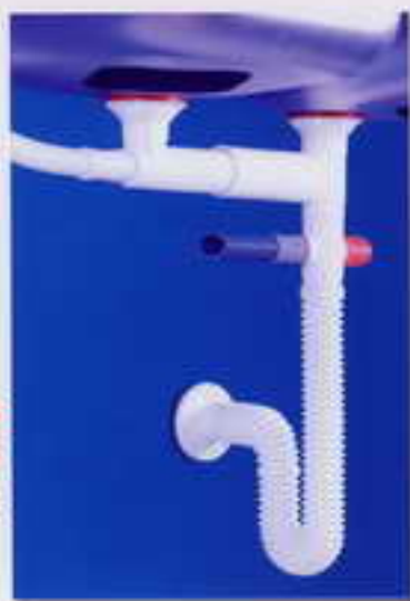
کد ۲۳- سیفون دولگنه آبا با لوازم سرریز مورد مصرف : سینکهای دو لگنه طرح پلاس