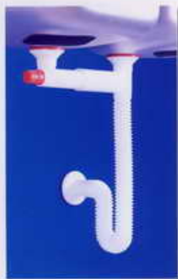
کد ۲۱- سیفون دو لگنه آبا با یک خروجی مورد مصرف : سینکهای دولگنه